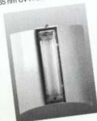
FR 8008, FR 8008 G, FR 8008 GE, FR 8008 EX - hygienische Fluginsekten-Bekämpfung in der Industrie. 2x20 oder 2x40 Watt - 365 nm-UV-A Leuchtstoffröhren im Zentrum der Reflektion mit unwiderstehlicher Lockwirkung.

Noch eins zum 4004 OMEGA: Jürgen Greubel und Horst Engelbrecht entwickelten das Design. Es erfüllt den Anspruch nach bestem Aussehen bei gleichzeitig höchster Wirksamkeit der Funktion. Der FR 4004 OMEGA hat mit seiner durchbrochenen Reflektorfläche, insbesondere bei Aufstellung des Gerätes mit der Leuchtstoffröhre zu einer hellen reflektierenden Wand gerichtet, eine lichte, dekorative und zeitlos modern wirkende Attraktivität. Das Schwarz des Bodenteils kontrastiert harmonisch mit dem matten Silber des Reflektors.