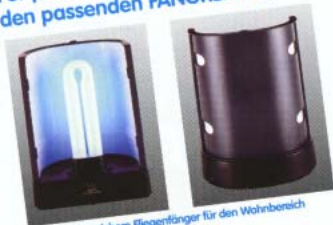
FR 3003 - der sichere Fliegenfänger für den Wohnbereich Maße: B 20 cm / H 27 cm / T 12 cm

Für jeden Bereich den passenden FANGREFLEKTOR.