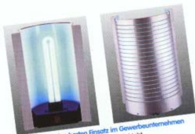
FR 4004 - für den harten Einsatz im Gewerbeunternehmen 40 Watt Super Power - 365 nm UV-A-Licht